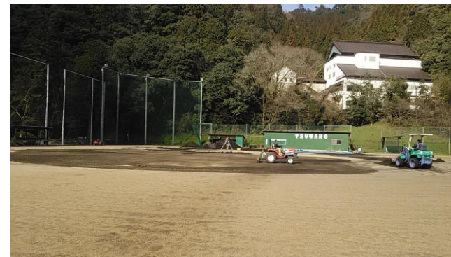
阪神園芸さんによる整備の様子

3月13日～15日の3日間で、内野グラウンドの改修工事が行われました。施行は「甲子園球場の神整備」で有名になった阪神園芸さんです。改修していただいたことに感謝をし、更なる練習を積んでいきます。