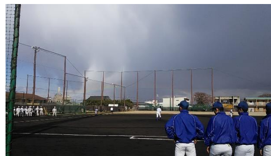
←膳所高校との試合の様子

2019年の春の関西遠征に行つて参りました。昨年選抜に出場した膳所高を含む4試合戦つて全勝してきました。関西出身の選手・保護者も大変喜んでくれた遠征でした。